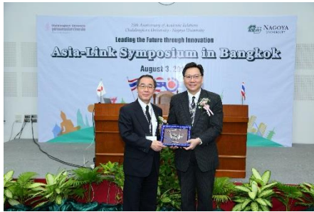
右：チュラロンコン大学 副学長 左：名古屋大学 総長