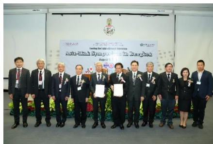
調印後の記念撮影