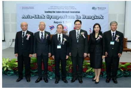
開会時の記念撮影