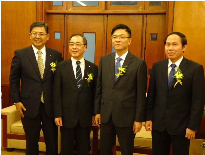
村瀬 十六銀行頭取 松尾 名大総長 ロン大臣 チャウ 法科大学長

15：40～16：00 レ・タイン・ロン司法大臣表敬 於：ハノイ法科大学・A棟（2階）211室 名古屋大学大学院法学研究科修了生レ・タイン・ロン氏の司法大臣就任祝い