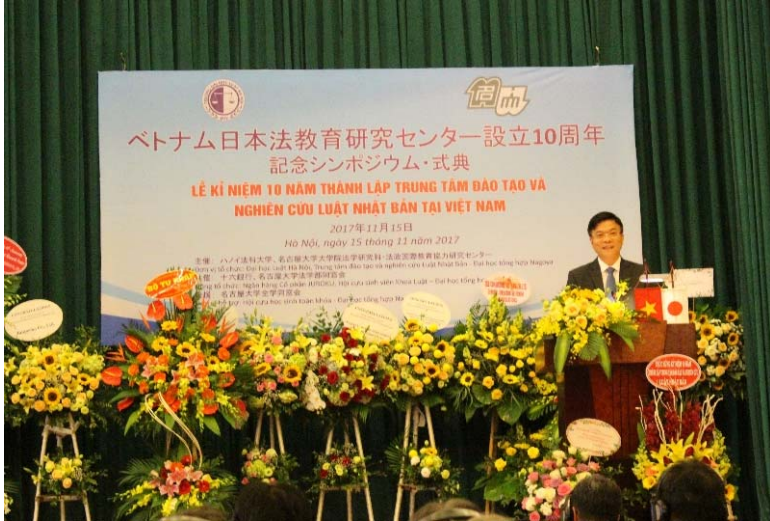
ロン司法大臣祝辞