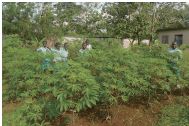
キャッサバが成長して子供たちが喜ぶ