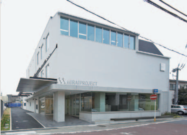
ミライプロジェクト新瑞橋（外観）

学びました。これまで営業職として製造業のお客様を中心に担当していたため、会計や金融の世界の用語やものの考え方がなかなか頭に入らず苦労したことが印象に残っています。