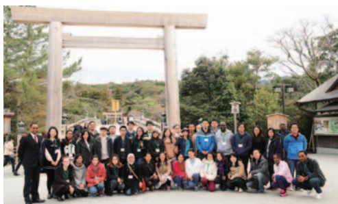
伊勢市おはらい町「観光と防災」ワークショップ

グローバルプレゼンテーション大会は、「Pechakucha」というプレゼンテーション形式を参考に実施した。「Pechakucha」は、講演者が20枚のスライドを1枚あたり20秒使ってプレゼンテーションを行う形式である。この形式によるプレゼンテーションのイベントは世界で開催されており、多くの大学や教育機関でも授業やプレゼン大会等の発表形式として用いられている（詳しくは http://www.pechakucha.org を参照）。本大会は、キャンパス内において分野を超えたアカデミックな交流の場を創出し、留学生と一般学生の交流を一層深めることを目的として、年2回開催した。公募及び推薦で集まった一般学生、留学生、学外からのゲスト6、7名が講演者となり、英語または日本語によるプレゼンテーションを行った。プレゼンテーションのテーマは研究内容の紹介、自国の紹介、趣味、留学体験など多様で、観客は文理系問わず様々な分野のプレゼンテーションを楽しむことができた。参加者数は、6月の回が30人程度、12月の回では50人程度であった。司会による通訳も行ったため、各プレゼンテーション後の質疑応答では留学生、一般学生共に活発なディスカッションが行われた。また各プレゼンテーションの合間には、参加者や講演者が交流することで学内におけるネットワーキングができる時間を設け、リラックスした雰囲気での国際交流の場にもなった。参加者からの評判も非常に高く、次回講演者やスタッフとして参加したいという声もあり、今後も引き続き開催していきたい。