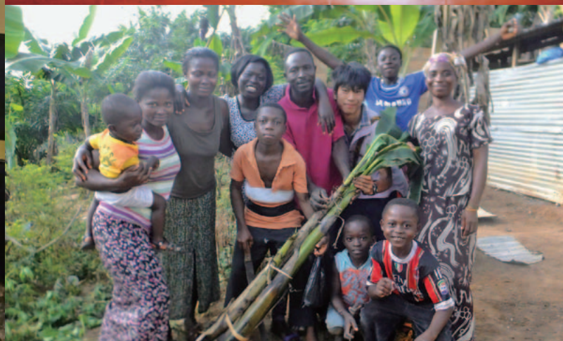
左：マレーシア支部 支部旗授与、右上段：2015年10月、カンボジアプノンペン市 カンボジアサテライトキャンパス入学式、右下段：ガーナの学校の自立支援活動 近隣住民からも協力してもらい活動を進めている