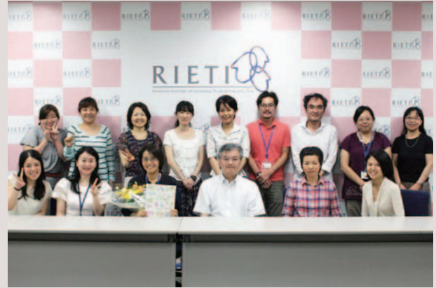
RIETI（経済産業研究所）の同僚たちと

ランがありました。全国様々な大学に学会などで行きますが、こんなに多国籍料理のレストランが近場にある大学はなかなかありません。そんな多様性を有した本山が自慢でした。