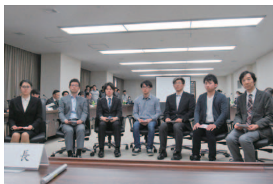
採択された事業代表者の方々

事業の内容は、実施後に本誌で紹介され、全学同窓会 HP でも公開されます。また、これまでに採択した事業を全学同窓会 HP で公開しています。