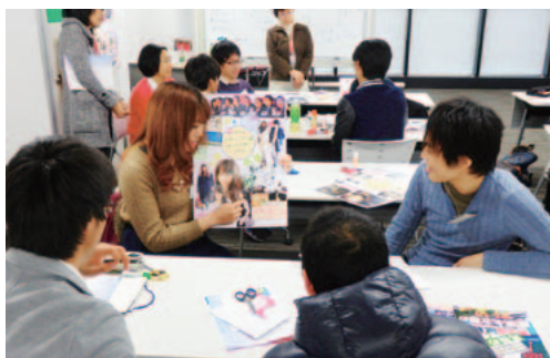
ドリームマップワークの様子

ワークエクスピアレンスプログラム 本人の特性上就業機会に恵まれなかった学生4名(精神保健福祉手帳所持者含む)に対し、就業体験を通じた自己特性理解を目的として、学内における