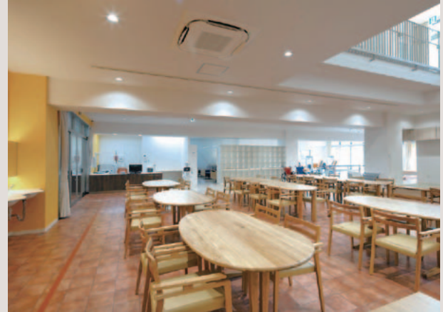
食堂兼機能訓練室

失敗した事業を整理し、経営コンサルティング会社に衣替えして東京で活動している中で、縁あって名古屋のエイチームと契約することとなりました。正社員0人、役員とアルバイト合わせて10名強の規模でしたがケータイ公式サイト事業が伸び始めていた時期でした。週に1日、短期のコンサルティング契