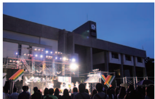
特設ステージの様子

このとき、第1グリーンベルト内に、名大祭本部実行委員会の所有するLEDライトによる装飾と、レンタルさせていただいたLED照明による通路の装飾が調和し、完成度の高い装飾を行うことができた。これによって、後夜祭などの暗い時間に行われる企画へ来場者を誘うことができ、また、帰路を楽しく且つ安全なものとすることができた。