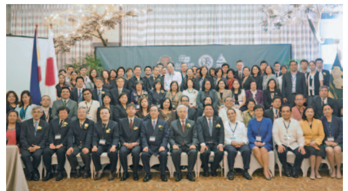
2016年3月 フィリピンサテライトキャンパス入学式

海外にいらっしゃる名古屋大学の同窓生の皆さん、皆さんの教育研究活動は大学を卒業して終わったわけではありません。国際開発、法整備支援研究、サテライトキャンパス学院博士課程教育等名古屋大学と共に学び、活動する機会はたくさんあります。積極的に参加ください。