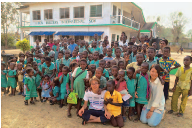
今年の春に後輩がガーナに渡航した時の写真

名古屋大学はガーナからの留学生が多く、留学生にはガーナの渡航をするうえでとても助けられています。また、ガーナにも名古屋大学のOBの方が駐在しており、お世話になっています。しかし、未だに名古屋大学の学生を十分に巻き込めていないのが現状です。今後は名古屋で学内外のイベントを通してガーナをもっと身近に感じることができる環境作りにさらに力を入れて取り組んでいきたいと考えています。今後とも応援のほどよろしくお願いいたします。