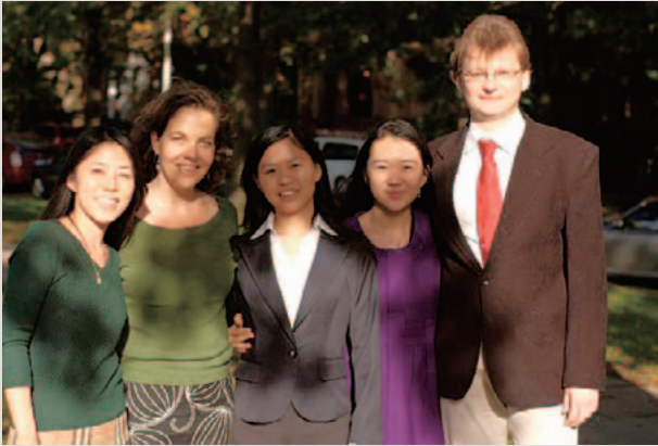
Yale 大学でのオフィスメイトたちと