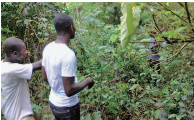
新たに始める新しい農地の見学 まだ木が生い茂っている

現在、孤児院の空き地に菜園と、2ヘクタールの土地を購入して農業を行っています。収穫ができれば子どもたちの食事に充てることができるということが農業に注目した理由です。しかし、今まで海外からの援助に慣れてきた孤児院には、すぐにお金が手に入らない状況をなかなか受け入れてもらえず、説得に数年もかかってしまいました。また、予算書もなく、どんぶり勘定でやりくりしていた学校で農地を買い農業を行うのは一苦勞です。時には、学校の経営者から口さえ聞いてもらえない期間が続いた時もありました。しかし、まず手始めに行った小規模の学校菜園の成功などが功を奏して、徐々に信頼