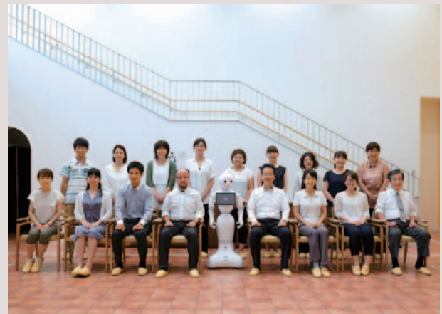
ミライブプロジェクト新瑞橋オープニングメンバー

2000年に成毛さんがマイクロソフト社長を退任し設立したインスパイアに入社しています。ここで投資ファンドの運営と経営コンサルティングの手法を