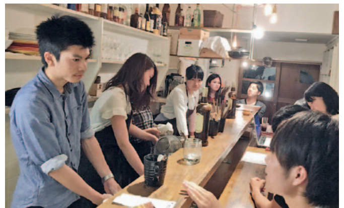
カフェにてガーナ料理を提供