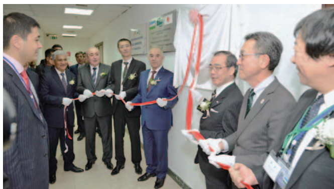
2015年10月 ウズベキスタンサテライトキャンパス開所式

名古屋大学は、平成26（2014）年8月、アジアサテライトキャンパス学院を開設し、アジアの公務員を対象に、職を継続しながら名古屋大学の博士課程に学ぶことのできる事業を開始しました。テレビ会議、インターネット、教員の現地派遣及びスクーリングを駆使することにより可能となった事業です。平成26年10月に学生7人を受け入れ、